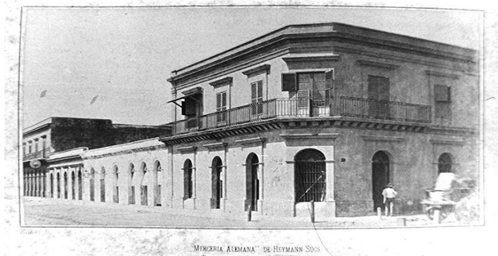
Imagen 4. Primer momento de la Mercería Alemana. Su estilo arquitectónico es coherente con las tendencias marcadas por el neoclasicismo. Como muchas edificaciones de su tipo con dos plantas, era a su vez casa comercial en el primer piso y vivienda particular en la segunda.

El neoclasicismo implicó la apreciación de la belleza y la estética. Implicó la revaloración de las artes, de la música, de la pintura, de la escultura, de la ópera [...] las construcciones eran mayormente dedicadas a museos, bibliotecas, teatros, provistos generalmente de pórticos, es decir, de un elemento que tenía su origen en las construcciones sacras de la antigüedad. Los almacenes, los hoteles, la arquitectura conmemorativa eran construidos bajo los esquemas funcionales del neoclásico por moda y por necesidad de manifestar un “buen gusto” funcional y sobriamente elegante y bello. (Alvarado, 2005, p. 97)