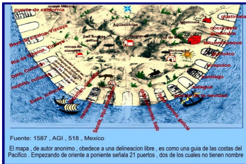
Imagen 1. Primer mapa donde se menciona Mazatlán dentro de una ruta marítima colonial; en él ya se puede observar una representación de un venado como distinción simbólica de la región. Si bien se sabe que no había villa o ciudad en ese territorio, se puede atribuir a que ya desde entonces se identificaba la bahía cercana al presidio de los mulatos (hoy Villa Unión) como un espacio que era parte de dicha población, o por lo menos que era frecuentado por los pobladores como lugar de paso hacia el Camino Real.

Interpretando al Mazatlán del siglo XIX como un texto: el paisaje urbano y su retórica de dominación