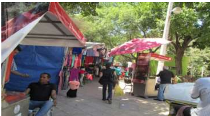
Foto 3. Vendedores ambulantes de repo en la plazuela Álvaro Obregón.