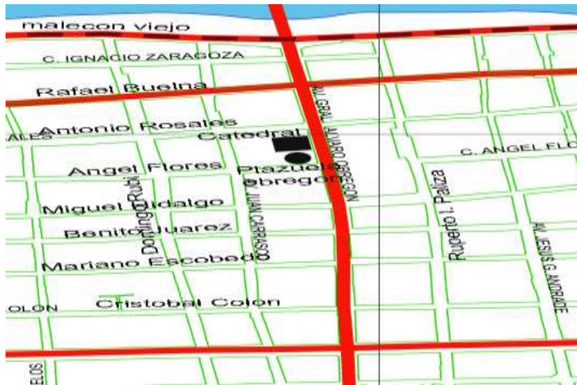
Figura 3. Centro histórico de la ciudad de Culiacán Sinaloa.