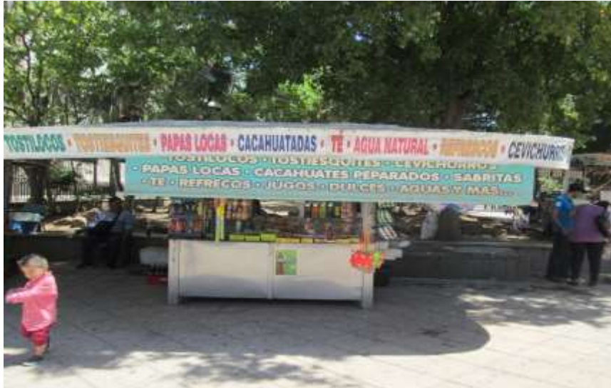
Foto 1. Vendedores ambulantes de fritangas, aguas frescas y refrescos en la plazuela Álvaro Obregón.