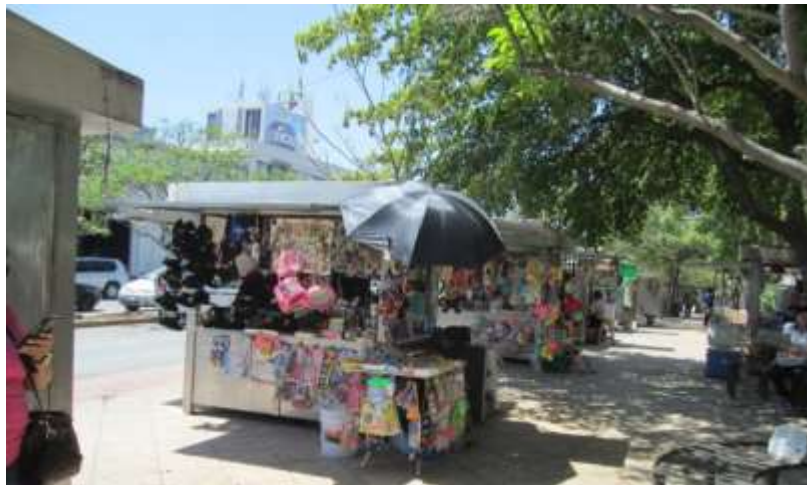
Foto 2. Puestos semi fijos en la plazuela Álvaro Obregón por la calle Miguel Hidalgo.