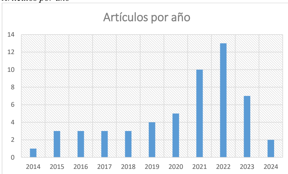
Figura 2. Artículos por año