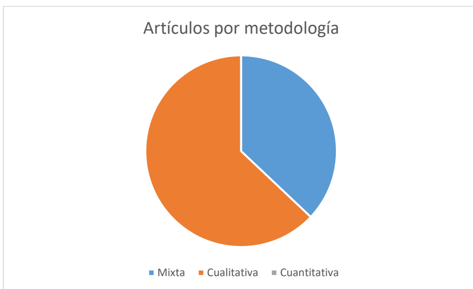
Figura 3 Artículos por metodología