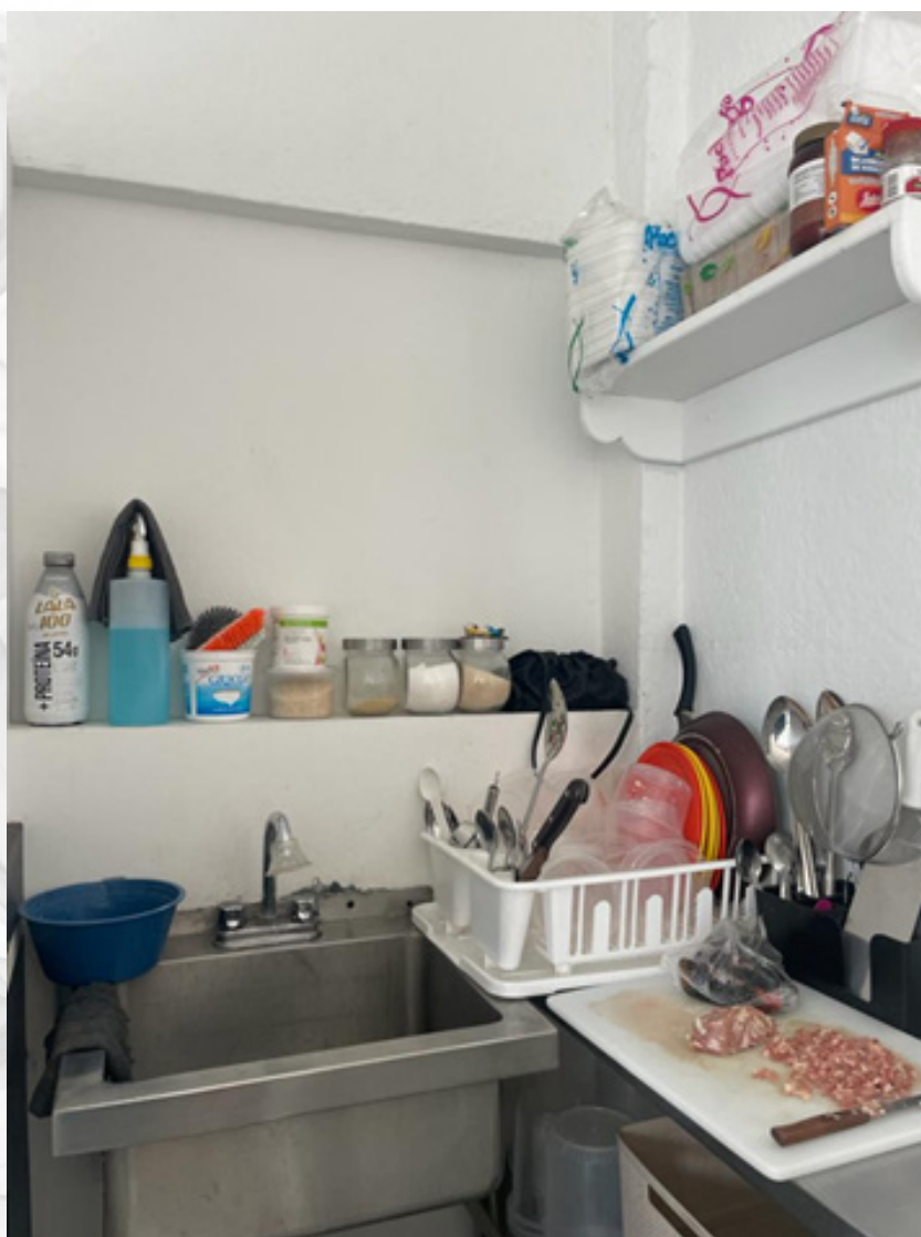
La cocineta de “El Nevado de Toluca”

Todos estos aspectos relacionados con la calidad, el orden, la higiene y la disciplina requieren mayor atención en los estudios del trabajo, pues constituyen elementos inherentes a la labor culinaria. En el caso aquí analizado, además, se vinculan con la subjetividad y la autoestima de las personas trabajadoras o propietarias, ya que representan formas de expresar su ética laboral y, en cierta medida, su identidad.