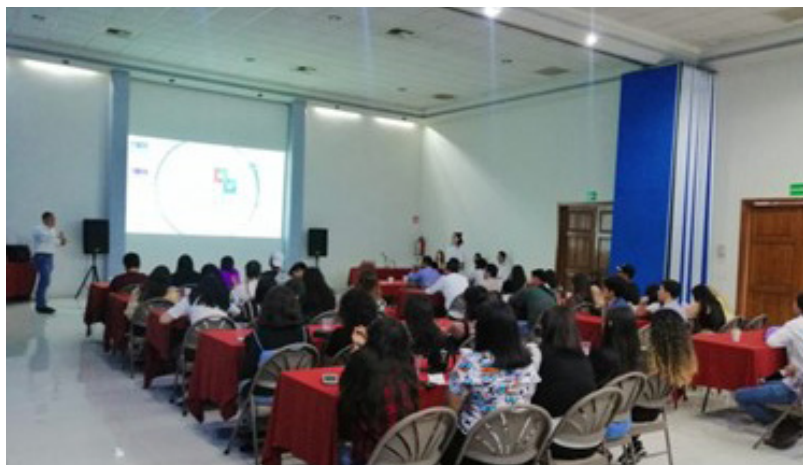
Fotografía 3. Estudiantes de LNCI en las instalaciones de Grupo Alianza Estratégica Portuaria (2022).

Estratégico, MDM ) expuso las funciones y servicios que ofrecen; así mismo, hablaron de sus experiencias laborales en el momento de realizar una operación de comercio exterior. También, nos explicaron cuáles eran los riesgos y las oportunidades de trabajar en aduanas y todo lo relativo a los programas que tienen para ofrecer a los nuevos egresados.