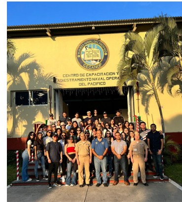
Fotografía 2. Estudiantes de LNCI, turno vespertino, en las instalaciones de la Fuerza Naval del Pacífico (2022), tomada por Lenis González.

En la visita a CIMA Group nos mostraron las instalaciones (bodega de cross docking) y el funcionamiento y el manejo de algunas grúas tipo reach stacker, con lo que pudimos observar el manejo de maquinaria para el traslado de contenedores y maniobras de carga y descarga de las mercancías. Se nos explicaron los procesos que personas dedicadas al comercio exterior realizan en sus actividades laborales diarias.