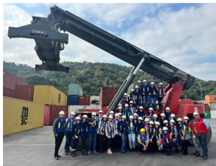
Fotografía 1. Alumnos de LNCI, turno vespertino, en CIMA Group (2022).

fortalecer los conocimientos de los alumnos mediante visualizaciones prácticas, acordes con sus estudios. Por ello, en este viaje realizado por los alumnos de cuarto año de la Licenciatura en Negocio y Comercio Internacional (LNCI) se visitaron cuatro empresas relacionadas con el comercio exterior y aduanas, que son: CIMA Group Operador Logístico, Fuerza Naval del Pacífico, Grupo Alianza Estratégica Portuaria, TAP Terminal y Recinto Fiscalizado de usos múltiples.