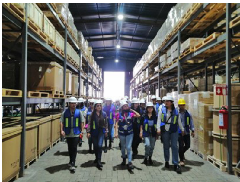
Fotografía 4. Estudiantes de LNCI turno vespertino en las instalaciones de TAP Terminal, Recinto Fiscalizado de Usos Múltiples (2022).

así como la forma en la que funcionaban gracias a unas bandas que transportan los granos de los barcos a los domos y de estos últimos a los vagones de tren. También nos explicaron que todas las operaciones que realizan tienen costos específicos, ya sea solo para moverlas de lugar o para retirarlas del recinto.