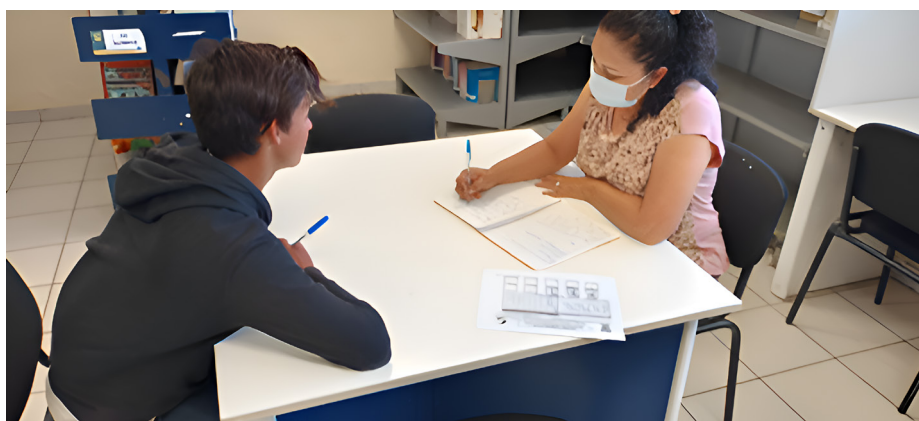
Figura 2 Docente impartiendo asesoría disciplinar individual

Nota. González del Río, M. P. (2024). Fotografía de creación propia [Fotografía].